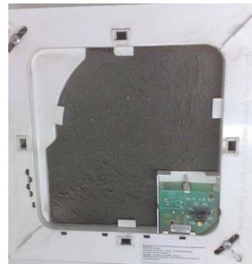
Symbolfoto B Innenseite Lüfter